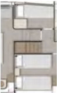
ALTERNATIVE LAYOUT LD 01

The Technical data, performances, designs and graphic reproductions are purely indicative, are not contractual, shall not constitute in any circumstances whatsoever any contractual offer by the shipyard and refer to European standard models of motor yachts built by the shipyard. The only valid technical reference or description is the specific parameters of each motor yacht cited only on purchase of the same. Therefore the only indications binding on the seller are contained solely in the sale agreement and in the relevant specific manual.