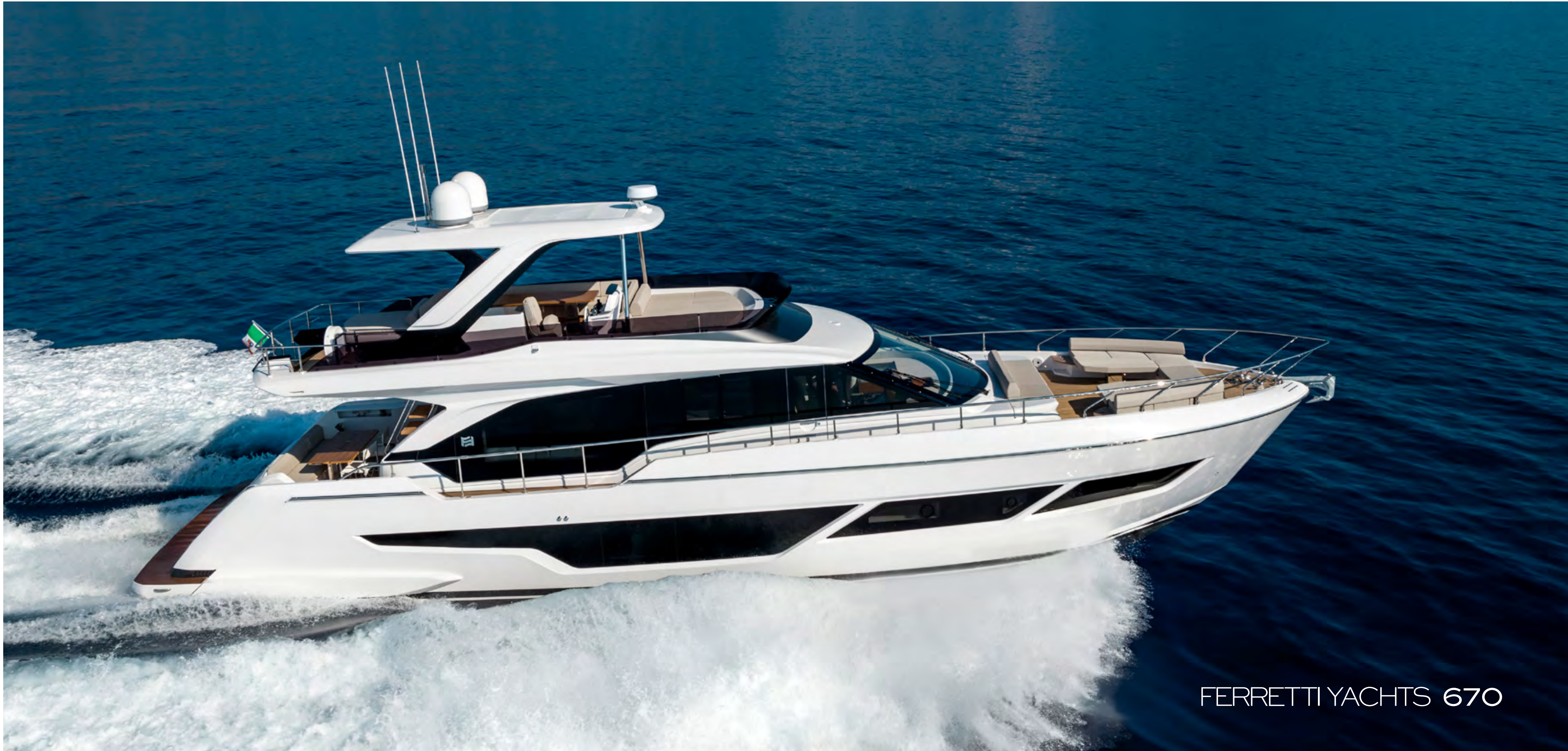
FERRETTI YACHTS 670