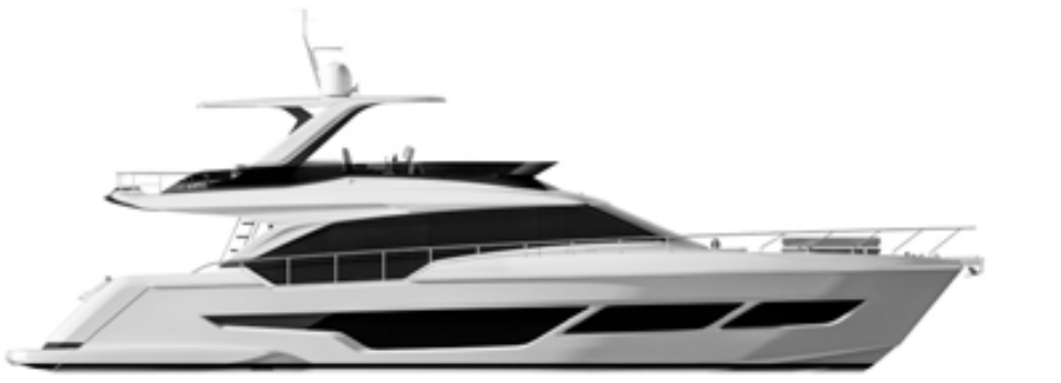
HARD TOP VERSION